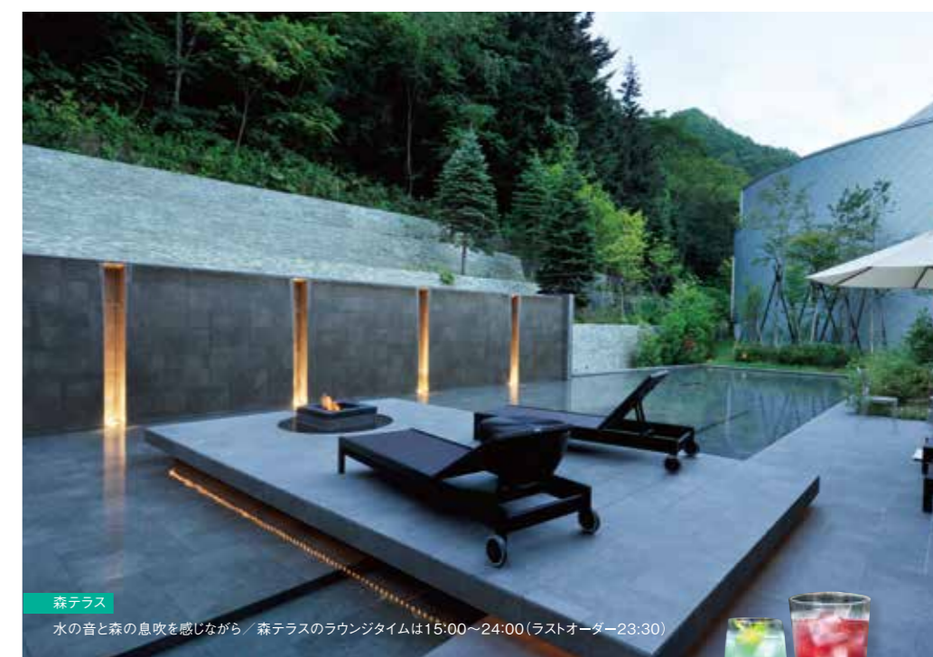
■森テラス 水の音と森の息吹を感じながら、森テラスのラウンジタイムは15:00~24:00(ラストオーダー23:30)