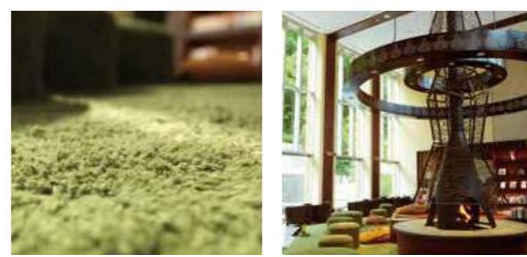
▲素足が気持ちいいカーベットが敷き詰められたロビーラウンジ

森の調を象徴する空間ともいえる「森ラウンジ」。中央の暖炉を覆うオブジェは天に向かって伸びる大木を、素足に心地よい緑のカーベットはくさくさと大地を表しています。高い天井から降り注ぐ水のカーテンは雨を受け、それを壁面にはこれら大地に芽を出す種が描かれ、ラウンジ全体が森の循環を表現しているのです。森の息吹に包まれる開放的なラウンジの奥には、まるで森の大きな切り株の中にある秘密の遊び場のような「森BAR」も。さまざまなカクテルやシングルモルトを嗜みながら、夏の夜を涼やかに心地よくお過ごしください。