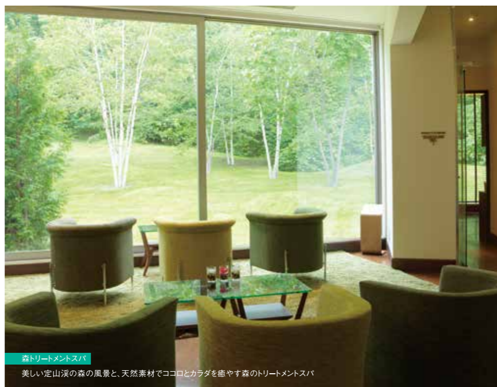
■森トリートメントスパ 美しい定山溪の森の風景と、天然素材でココロとカラダを癒やす森のトリートメントスパ

森の緑が もたらしてくれる 深いリラククス効果 森の中は木々や植物が放つさまざまな階調の緑色であふれています。光の三原色である赤・緑・青の中で、緑は人にとって特別な意味を持っています。人間の目は赤や青よりも緑の階調の変化を敏感に識別するといわれ、パソコンのモニターでの色情報も2倍もの階調を割り当てています。緑は人間にとって、もっとも見やすい色であり、気持ちを落ち着かせてくれるのです。そんな森の緑の力でココロとカラダを癒やしてくれる空間が「森スパトリートメント」。心地よい森の緑の心理効果によって安心感や穏やかさに包まれながら、夏ならではのリラククスタイムを満喫してみたいかがですか。