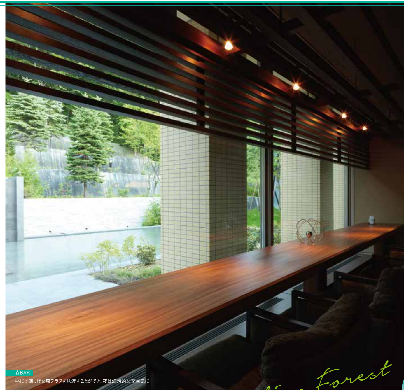
■森BAR 昼には涼しげな森テラスを見渡すことができ、夜は幻想的な雰囲気に

●1Fトリートメントスパ ●ご利用時間/正午~深夜0:00(最終受付23:00)