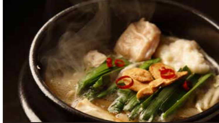
モツ鍋 臭みの少ないモツにピリッと辛味のある魚醤とにんにくの旨味を加えた醤油ベースのスープです。

「森ビュッフェ」では、シェフが窯で焼きあげたピッツアを提供。新鮮食材に彩られた焼きたてあつあつのピッツアをご賞味ください。生地はトルティーヤ、全粒粉、ナポリ風の3種類からお好みのものをチョイスすることができ、トッピングも多数ご用意しております。この他、ビュッフェスタイルで提供する料理には、彩り豊かな野菜やお肉など、旬の食材を生かした和洋中創作料理の数々。ワインセラーには、イタリア産を中心にボルドーやブルゴーニュといったフランス産など、豊富なワインをストックしており、焼きたてピッツアやビュッフェ料理と合わせて至高のディナータイムをお楽しみください。