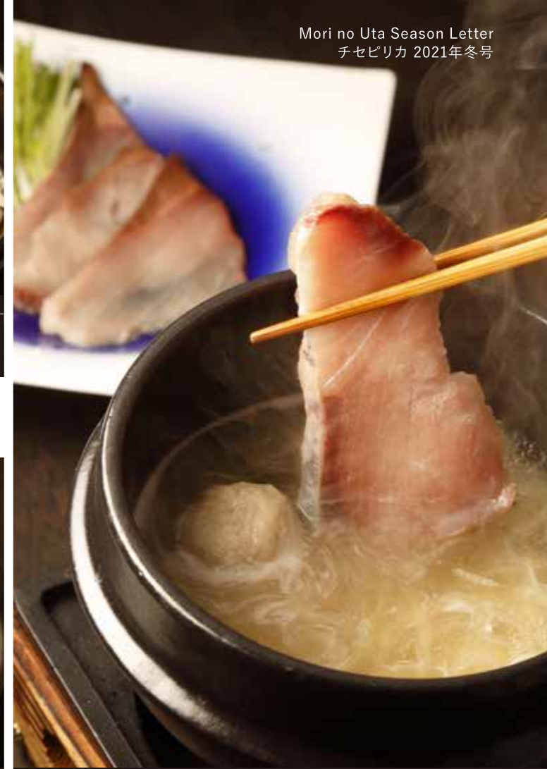
プリのしゃぶしゃぶ ゆず塩香る出汁に北海道産のプリをしゃぶしゃぶでどうぞ。