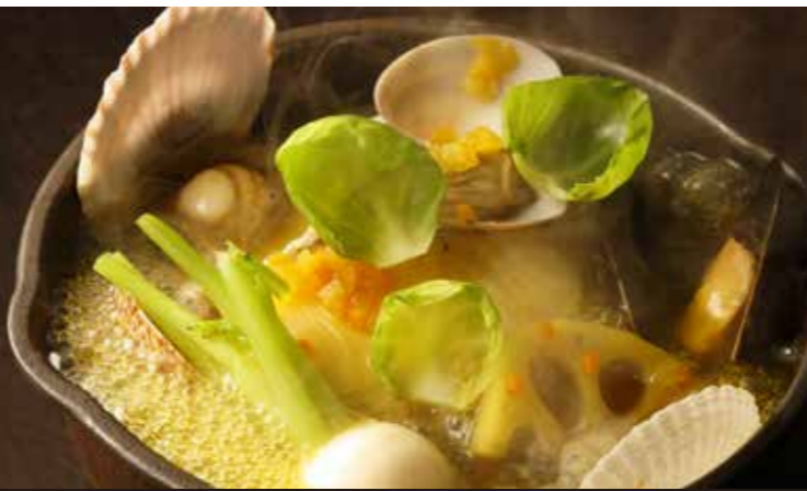
プイヤベース 北海道産鰯と魚介の旨味の効いたサフラン香るフランス料理の寄せ鍋です。