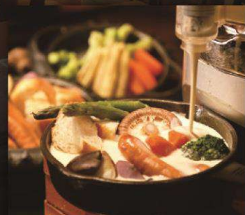
森の調特製 チーズフォンデュ仕立て

お酒によく合うオードブルバリエ。中でも牛肉の希少部位・トモサンカクを使用したローストビーフは絶品。