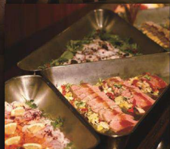
オードブルバリエ

季節の野菜や鮮魚をふんだんに使用した様々な前菜をご用意。色とりどりの春のメニューをお楽しみください。