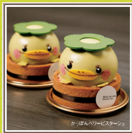
かっぱんベリーピスターシュ