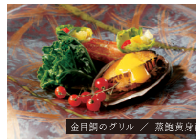
金目鯛のグリル / 蒸鮑黄身酢