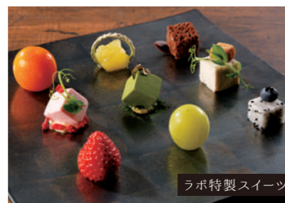
ラボ特製スイーツ