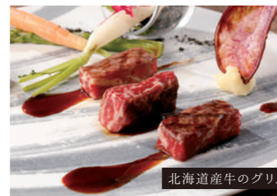
北海道産牛のグリル