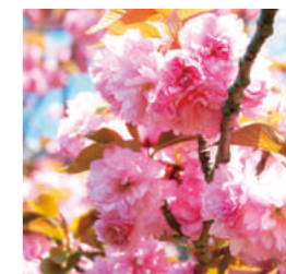
八重桜(ヤエザクラ)