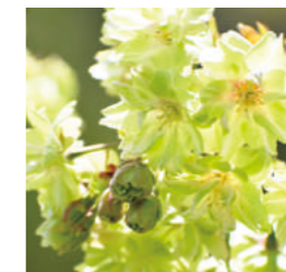
御衣黄桜(ギョイコウザクラ)